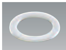
パッキン(ポリエチレン発泡体)