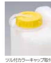
ツル付カラーキャップ取付例