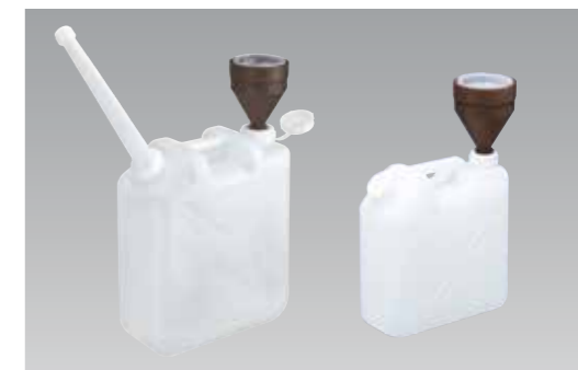
左:0836,2041N装着イメージ 右:0839装着イメージ

●0836-0839の違いはキャップの大きさです。 ■通常在庫品 ■3～5日 ■7～10日 ■材質/ポリエチレン(PE) ■製造国/日本 ※寸法には許容差があります。(単位mm)