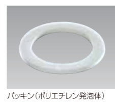
パッキン(ポリエチレン発泡体)