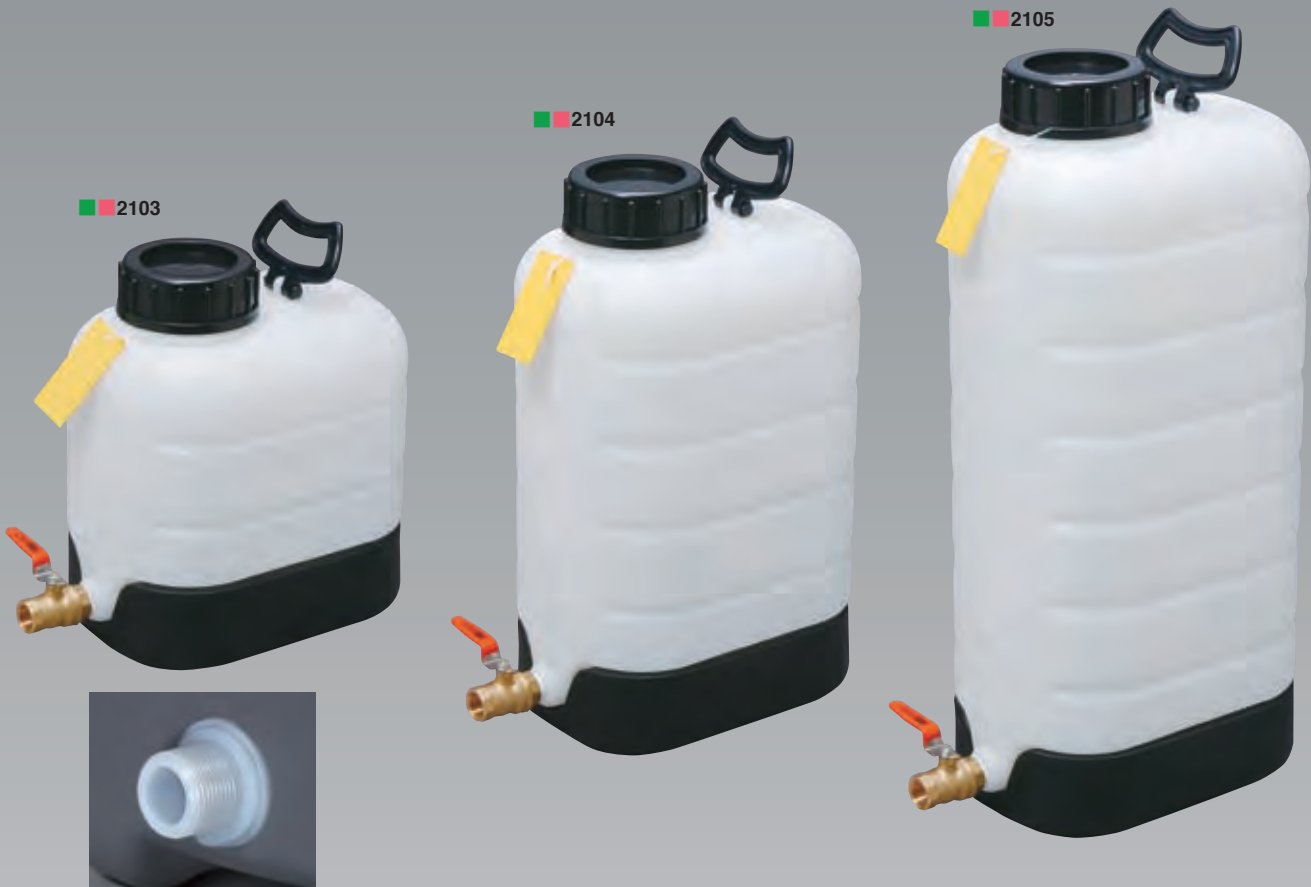
ボールコックオスネジ(ニッブル)