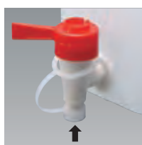
液ダレ防止先端キャップ (コックは取り外しできません)