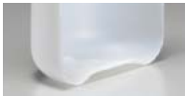
内面底部に凹凸があります。